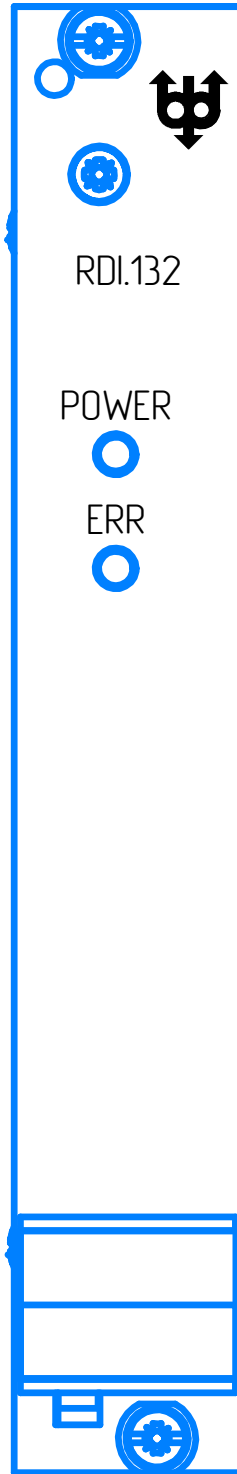
Рисунок Б.1 – Лицевая панель модуля